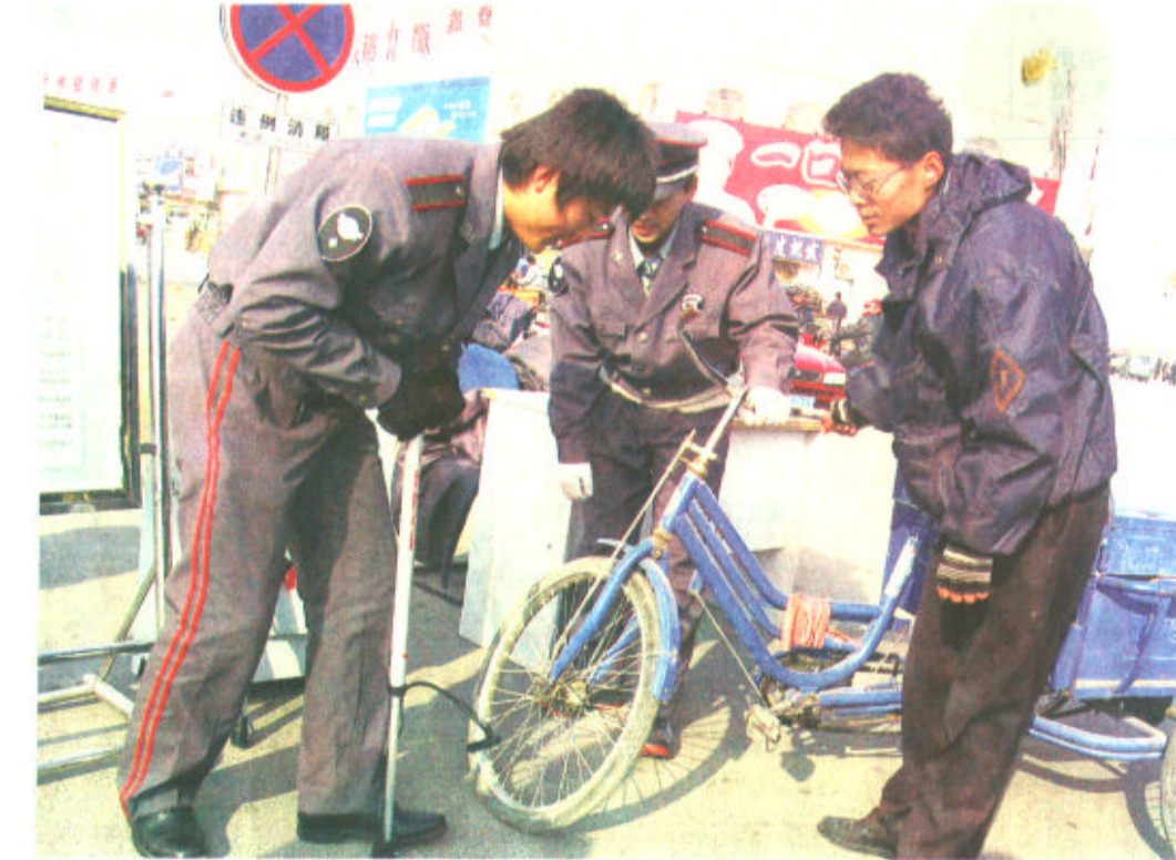
为了方便广大社区居民,真正发挥社区警务室的便民、利民作用,东营区东城街道办事处商贾城社区警务室在商贾城主要路口设立了便民服务站。两名工作人员向来往居民发放《警民联系卡》等自制宣传车,配备了天气预报牌,并实施了接受求助、免费维修自行车、免费打气、义务照看小孩等十余项服务措施。自便民服务站设立以来,平均每天接受求助、咨询人员达20余人,受到了广大居民的好评。(本报记者 李波 通讯员 孙桂花 黄登库)

利津讯 进入11月份以来,利津县各乡镇物资交流会相继召开。为确保物资交流会期间文化市场尤其是演出市场的健康、有序和繁荣,利津县文体局采取有效措施,加大了对物资交流会期间各文艺演出团体的监管力度,取得明显成效。 他们积极争取领导支持,会同公安、工商等部门相继召开专题会议,就如何确保物资交流会上的演出不出问题进行了具体安排。县文体局还召集各演出团体负责人会议,对各演出团体的资格和演出内容进行严格审查登记,并按照《演出管理条例》的有关规定,同其签订《责任书》,要求其增强政治观念和安全意识,依法接受管理,做到健康、文明演出。同时加大了人员和车辆的投入,对各乡镇物资交流会演出团体的演出,实行全程监管。