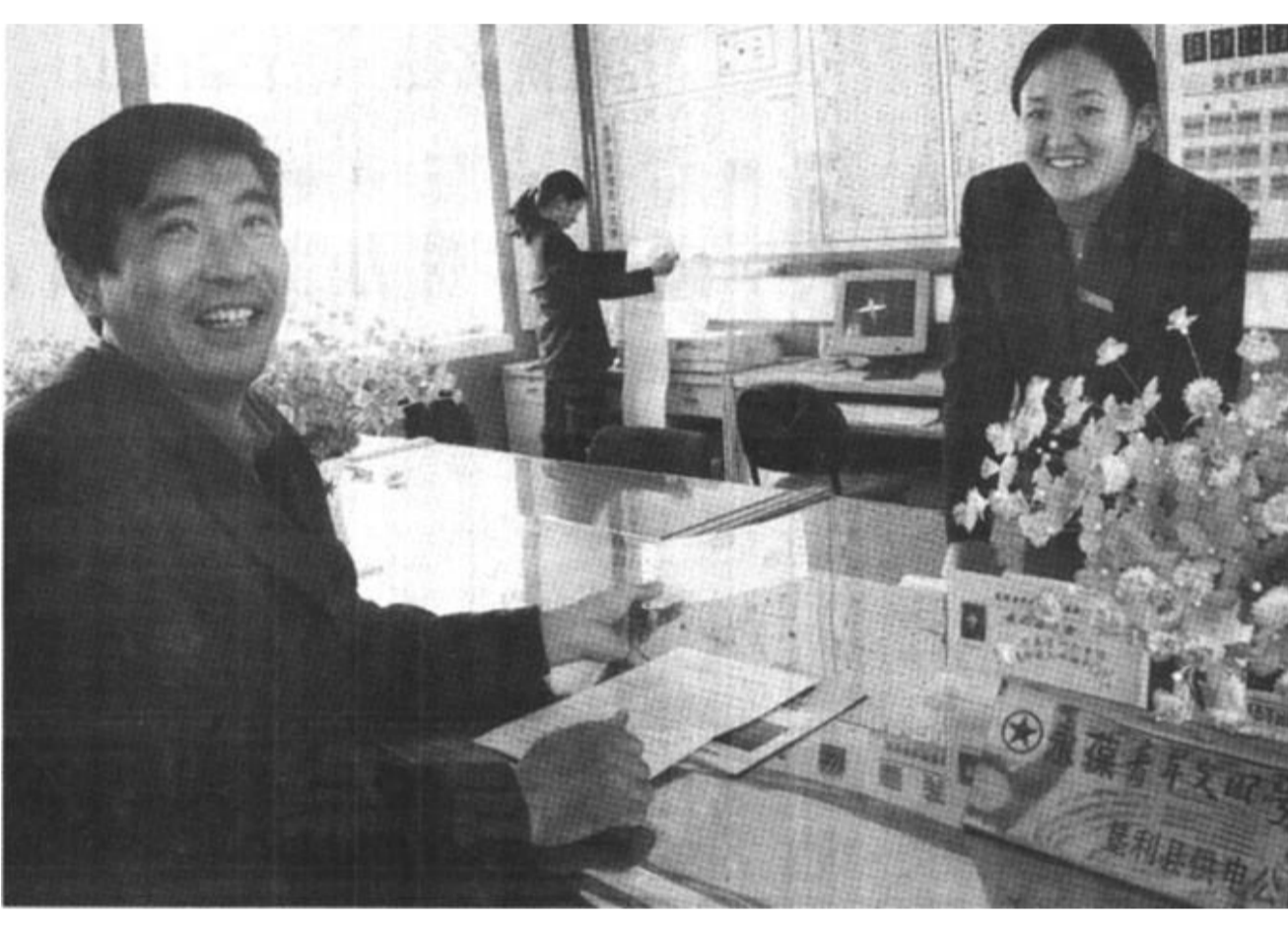
国家电力公司“农电示范窗口”——垦利县永安供电所积极开展“为人民服务，树行业新风”活动，在完成农网改造的同时，大力整顿电力市场，提高管理水平和服务水平，使农村用电保证率达到99.3%以上，有力地推动了当地农村经济的发展。

垦利讯 油田帮扶乡镇工作是新时期深化油地结合、促进区域经济发展的一项重大举措，在第二轮帮扶工作刚刚开展的三个月内，垦利县四个油田帮扶工作组立足乡镇实际，在加快区域经济发展上狠下功夫，全县油田帮扶乡镇工作成效显著。 帮助乡镇发展加工业，壮大了乡镇经济实力。孤东采油厂帮扶工作组利用黄河口镇土地宽裕和部分群众种植薄弱的优势，协调废旧油管线300根，废旧油杆100根，帮助该镇建成年加工薄荷粗油3万吨的薄荷油加工厂两处，截至目前，全镇已种植薄荷1.4万亩，薄荷产业已成为黄河口镇的主导产业。 结合自身优势，帮助改善群众生产条件。电力管理总公司在帮扶的三个月中，投资18万元帮扶董集乡在黄河滩区优质蔬菜开发基地架设2公里高压电力线路一条；投资6.5万元帮扶董集乡在总干扬水站架设0.6公里高压电力线路一条；投资1.5万元帮助董集乡在工业园区新上变压器一台，解决了工业园区施工用电难题。 加强基础设施建设，改善办公条件。胜利采油厂工作组已为胜坨镇小城镇建设投入29万元；为胜坨镇第二中学更换铝合金门窗1450平方米；为胜坨镇派出所办公楼建设投入资金20万元。孤东采油厂帮扶工作组也积极协助黄河口镇政府建设办公楼，目前，已协调水泥100吨。 油地共建、相互支持，油区治安有了进一步好转。在油田帮扶的乡镇中，被帮扶乡镇始终把搞好油区治安，协调处理好工农关系作为帮扶工作的重点来抓。目前，被帮扶的四个乡镇治安良好，均未出现大的涉油案件，为油田的增储上产提供了良好的外部环境。 (李建军)